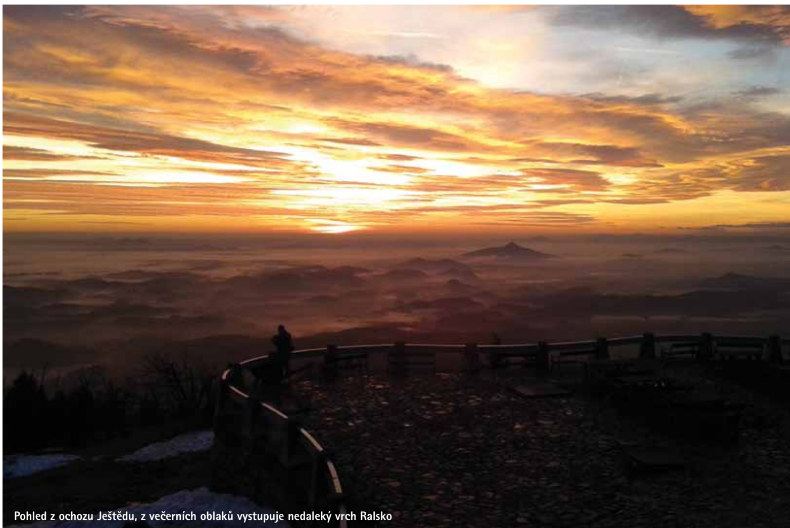
Pohled z ochozu Ještědu, z večerních oblaků vystupuje nedaleký vrch Ralsko

Od té doby zdobí stříbrný kužel na vrcholu Ještědu severní Čechy a je cílem