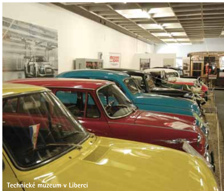
Technické muzeum v Liberci

Pokud máte raději techniku než architekturu, pak se podívejte do technického muzea. Je nedaleko centra a najdete v něm dost velkou sbírku automobilů, motorek či modelů autíček. Můžete se tady vyfotit v trabantu nebo se podívat na auto, které se k nám mělo dovážet z Indie a prodávat za 99 000Kč.