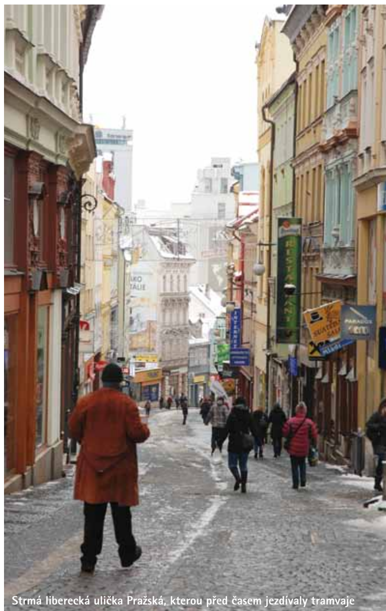
Strmá liberecká ulička Pražská, kterou před časem jezdily tramvaje