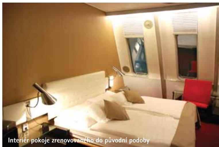
Interiér pokoje zrenovovaného do původní podoby