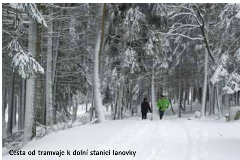
Cesta od tramvaje k dolní stanici lanovky

byla navržena speciálně pro Ještěd. Například plyšová závěsná křesla v chodbě u hotelových pokojů, osvětlení, nábytek, skleněné, betonové a keramické dekorace na stěnách, dveřní kování, zábradlí a další detaily jinde než na Ještědu nevidíte. Dokonce i porcelán a sklo speciálně navrhl designér Karel Wunsch. Ten ve svém návrhu vycházel z podobnosti mezi konstrukcí