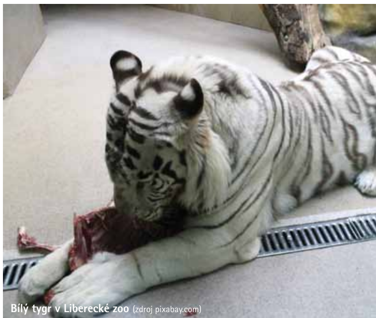
Bílý tygr v Liberecké zoo