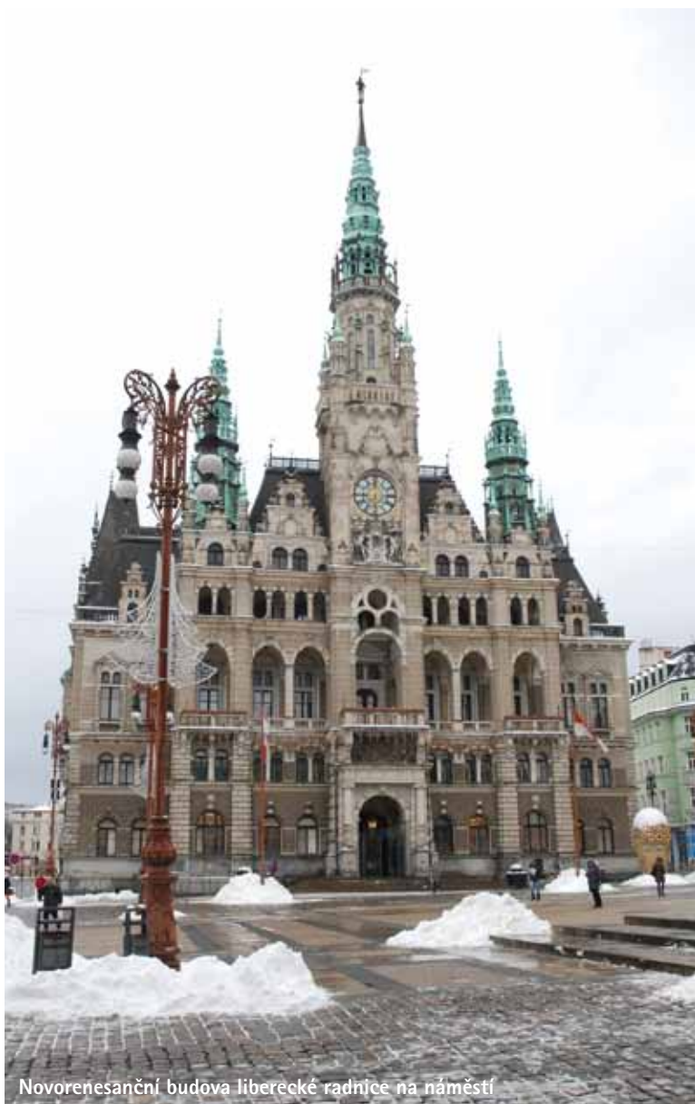
Novorenesanční budova liberecké radnice na náměstí