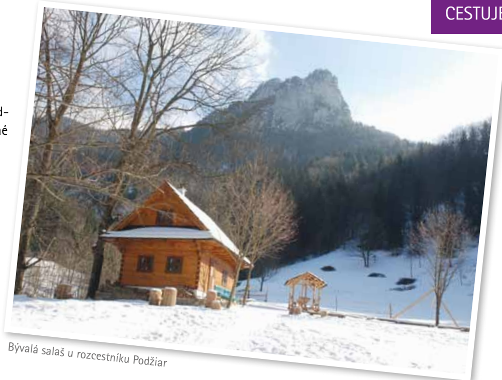
Bývalá salaš u rozcestníku Podžiar

v Dierach je v zimě pro neschůdnost uzavřena, ale jedna – Dolné diery – je průchozí i za ledu a sněhu. Do oblasti Jánošikových dier je třeba z Terchové dojít asi 2,5 km pěšky nebo se svézt autobusem. Začátek trasy je u hotelu Diery, kde je i velké parkoviště a pěkná restaurace. Cesta od hotelu do Dolných dier je značena modrou barvou. Po krátkém úvodním úseku vedoucím pěkným lesem se zanedlouho zanoříte do úzké skalní štěrbině na mnoha místech pokryté le-