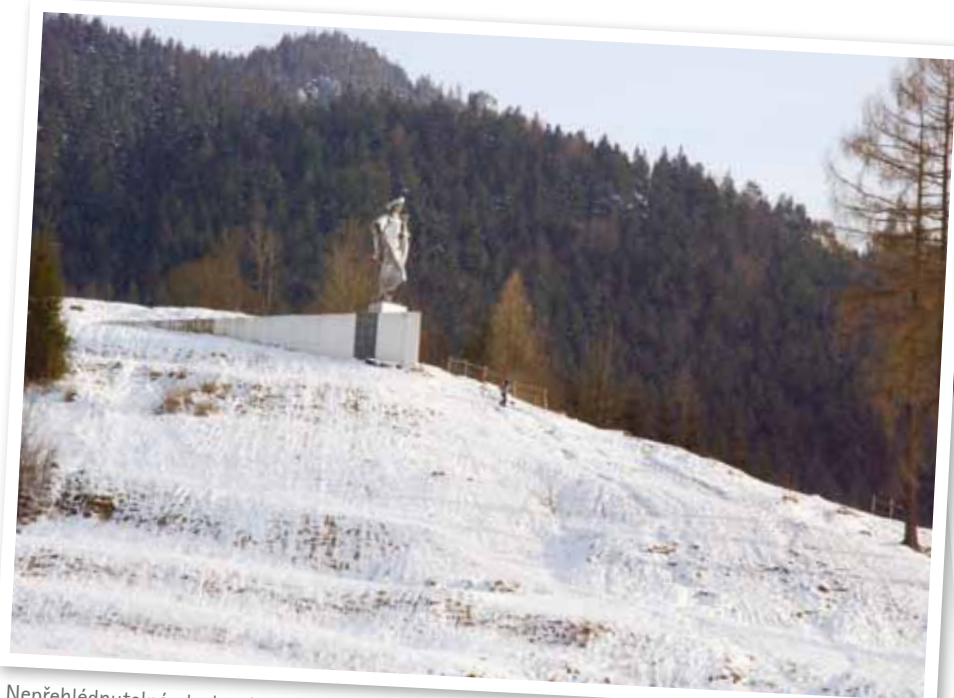
Nepřehlédnutelná plechová socha Juraje Jánošíka postavená v roce 1988 k 300. výročí jeho narození