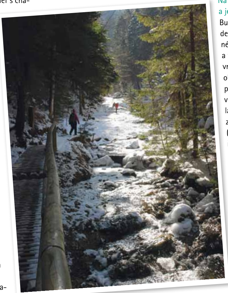
Cesta lesem k Dolným dieram

Budete-li mít na výlet jen jeden den a bude-li zrovna slušné počasí, nebuďte troškaři a vydejte se hned na nejvyšší vrchol pohoří. Nemusíte se obávat náročného výstupu, protože téměř do sedla pod vrcholem vede kabinková lanovka a k lanovce jede z Terchové linkový autobus (zjistěte si předem jízdní řád – autobus nejedí příliš často). Zdatní turisté ale mohou pochopitelně lanovku vynechat a vydat se na bezmála tisícimetrové převýšení pěšky. Nás ostatní, co pojedeme lanovkou, čeká od její horní stanice na vrchol Velkého Kriváně pouhých 209 m převýšení. Po výstupu z lanovky se ocitnete ve výšce 1 500 m n. m. nad hranicí lesa v pásmu vyso-