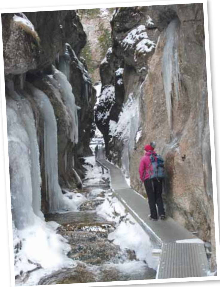
Dolné diery jsou schůdné i v zimě

skalách s protékajícím potokem. Celkem se rozlišují Horné, Dolné a Nové diery. Najdete zde na dvacítku vodopádů, spousty železných žebříků, lávek a řetězů. V zimě voda, sníh a mráz promění Diery v kouzelné ledové království, které stojí za to vidět. Většina cest