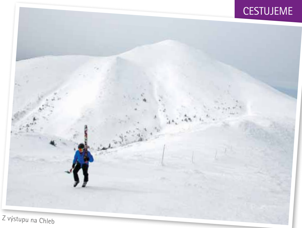
Z výstupu na Chleb

Jedním z turistických center Malé Fatry je malá podhorská obec Terchová. Odtud jsou výborně dostupné trasy obou výletů, které si v článku představíme. Dají se zvládnout během víkendu. Terchová leží na severní straně hlavního hřebene. Je možné se sem snadno dostat autem, ale i veřejnou dopravou (vlakem do Žiliny a dál přímým autobusem). O ubytování a stravování zde není nouze díky mnoha příjemným penzionům a několika restauracím. Mimochodem Terchová je rodištěm slavného zbojníka Jánošíka, který se narodil v osa-