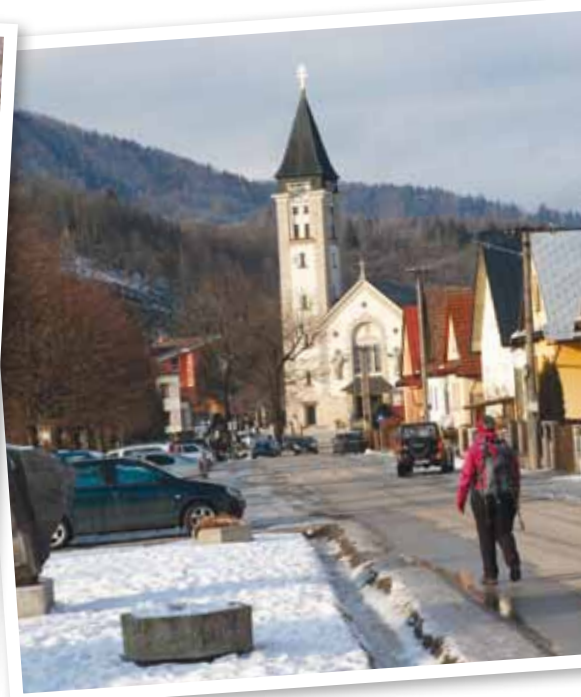
Terchová s kostelom sv. Cyrila a Metoděje, kde je zajímavý pohyblivý dřevěný betlém