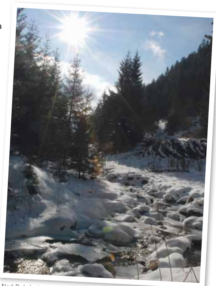
Nad Dolnými dierami se soutěska otevře do malebného údolí