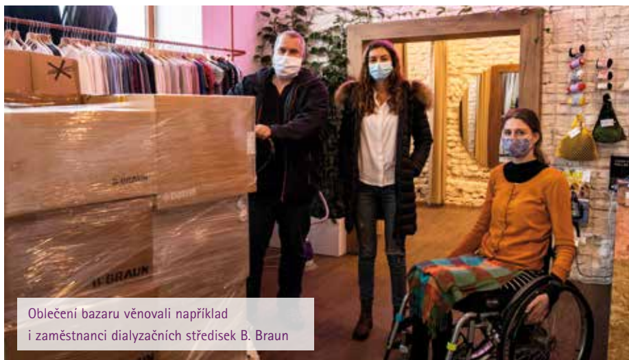
Oblečení bazaru věnovali například i zaměstnanci dialyzačních středisek B. Braun

Zásadní a hlavní myšlenkou je integrace vozičkářů do běžného života. Obchody slouží jako tréninková pracoviště vozičkářů, kteří tvoří většinu zaměstnanců. Tito lidé dříve nedobrovolně trávili svůj čas zavření v útrobách bytu, v sociální a komunikační izolaci, bez vize, že by ještě někdy mohli normálně pracovat a být společensky plat-