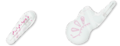
Actreen® Mini Cath