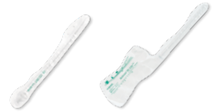
Actreen® Hi-Lite Cath