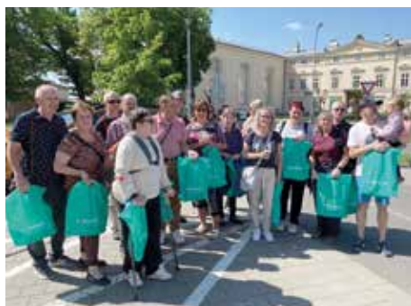
ČESKÉ ILCO, stomičtí pacienti a odborníci z B. Braun na Toulkách za zdravým pohybem